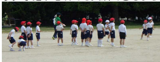
楽しく走っています。(2年B組)

下駄箱のくつはご覧の様にかなりきれいにそろえられています。くつはきちんとそろえられています。家庭や地域でも実践できるようになるとすばらしいと思います。