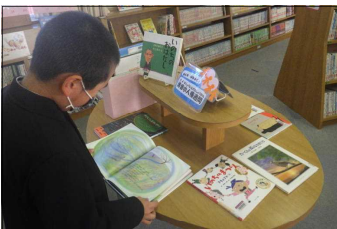
人権図書コーナー

11月24日(火)から12月4日(金)は校内の人権週間です。清音小学校では、「なかよし郵便」、人権スローガン、人権標語・作文の応募、人権図書コーナーの設置などに取り組みます。これらの取組を通じて楽しい学級や学校を作ろうとする態度や友達のよさに気づき、友達と仲良くしようとする心情を育てたいと思います。