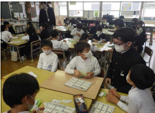
九九かるたをしました

11月26日(木)、清音小学校を卒業した総社西中学校の2年生が来校して1年生から4年生までの学習を支援してくれました。1年生は書順の確認をしてもらいました。2年生は九九かるたの問題を出してもらいました。3年生はアルファベットビンゴの問題を出してもらいました。4年生はリコーダー練習を見ていただきました。中学生に優しく教えていただいたので子どもたちはとても張り切って活動していました。