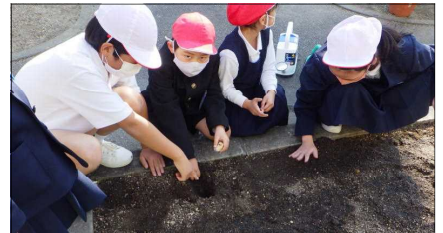
チューリップを植えました。

卒業式・入学式を一杯の花でお祝いするため、1年生と6年生は校舎の玄関前の植え込みにチューリップを植えました。2年生と5年生は周囲のプランターにパンジーの苗を植えました。3年生は花壇やプランターの札作り、4年生はプランターへの土入れをしました。