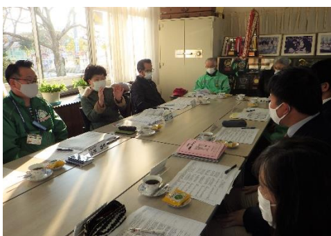
各委員から貴重なご意見をいただきました。

1月21日(木)3・4校時は授業参観でした。(6校時にはクラブの参観もありました。)