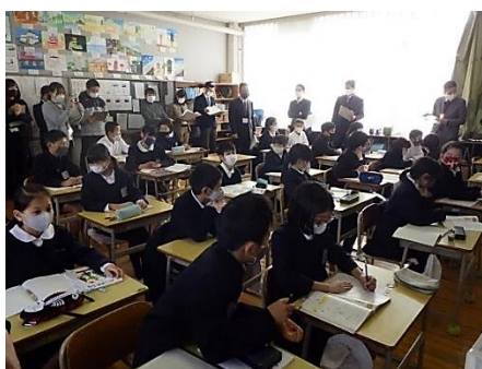
大勢の先生に少し緊張気味

「いただきます」には2つの感謝の意味があるそうです。1つ目は、食事に携わった方々への感謝です。つまり、料理を作ってくれた方、配膳をしてくれた方、野菜を作ってくれた方などへの感謝です。2つ目は、食材への感謝です。肉や魚、お米や野菜、果物にも命があります。私たちはその命をいただいて自分の命を生かすことができます。そのことへの感謝です。食事の時には多くの命に支えられていることを思い出してください。※朝礼では「ごちそうさま」のことも言いました。